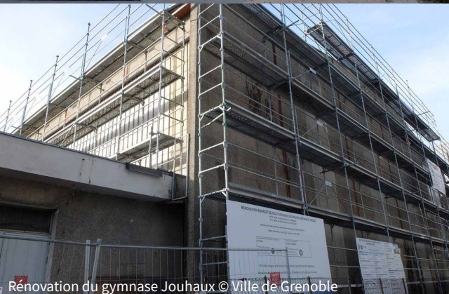
Rénovation du gymnase Jouhaux

► La rénovation du gymnase Jouhaux prévue dans le cadre du plan gymnase. Ces travaux visent une rénovation exemplaire : installation de panneaux photovoltaïques et d'une peinture claire en toiture, amélioration de la qualité de l'air, mise en accessibilité et, bien entendu, amélioration de la performance énergétique du gymnase. Au total, 35 % d'économies d'énergie sont attendues, hors production photovoltaïque (90 milles kWh de production annuelle minimale).