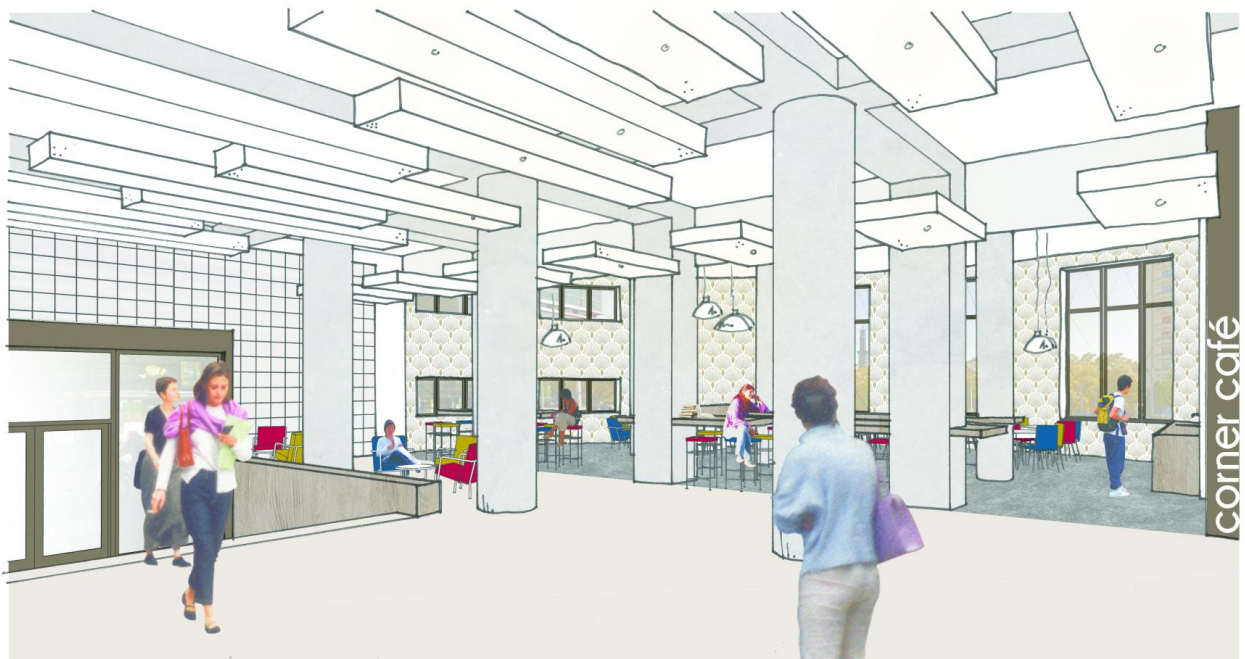
La Bibliothèque d'Etude et du Patrimoine se transforme