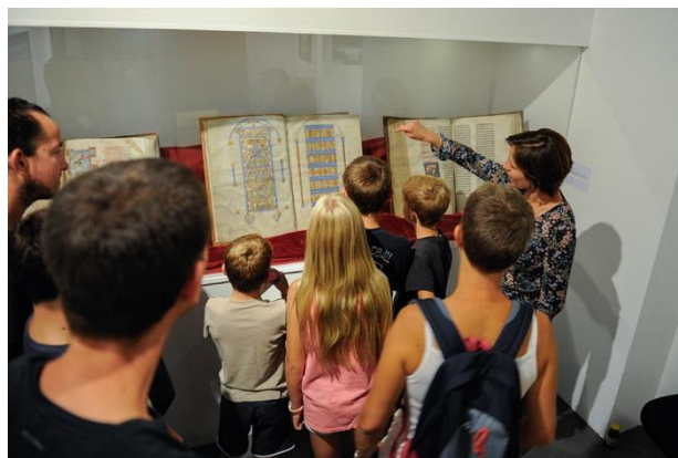
Les trésors de la bibliothèque patrimoniale