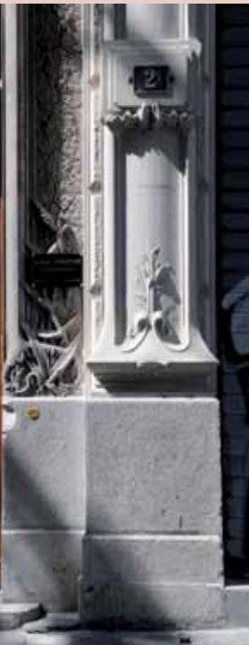
2 boulevard Gambetta, début XX e , détail vantail et piedroit de l'encadrement 2 boulevard Gambetta, early 20th c., detail of door and jamb