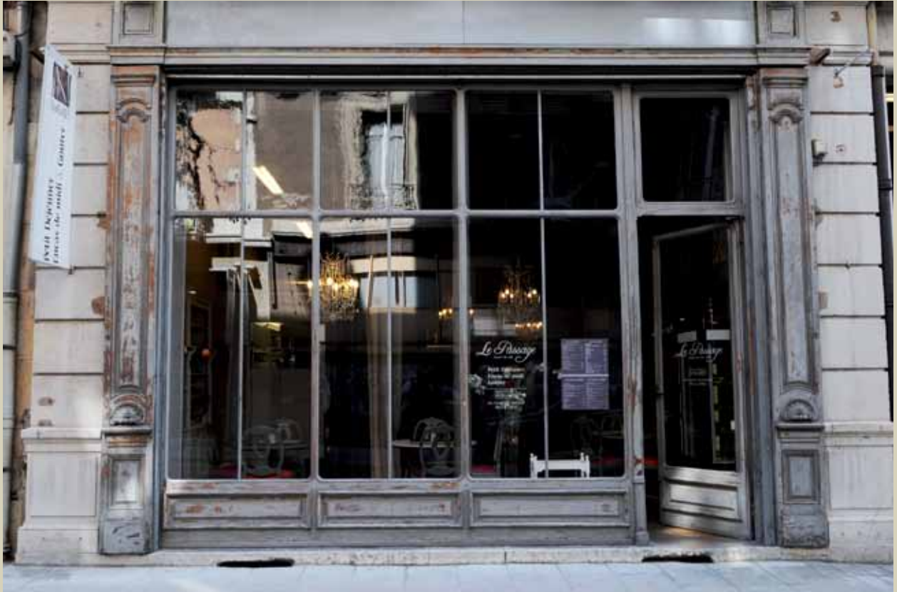
2 rue Paul Bert