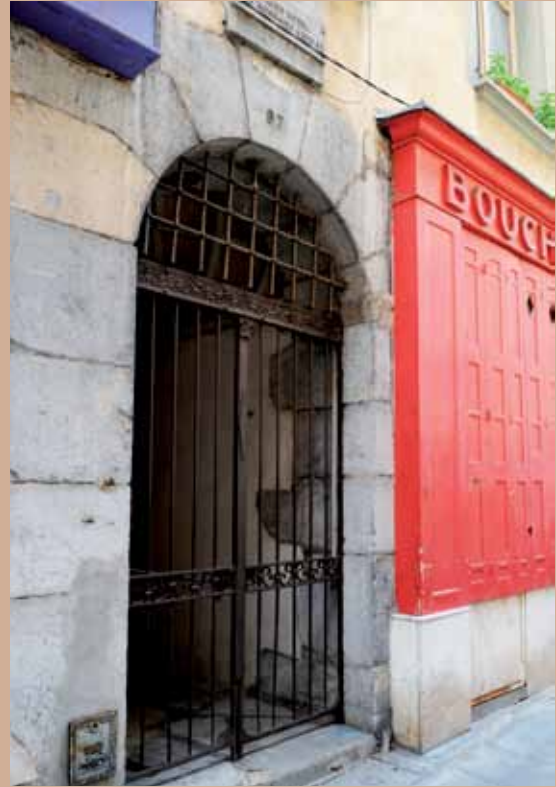
97 rue Saint-Laurent