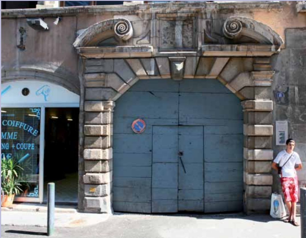
8 rue Chenoise, XVII e , ancien hôtel d'Ornacieu, portail à bossages de pierre bicolore surmonté d'un fronton cintré ouvert à enroulement rentrant 8 rue Chenoise, 17th c., former Ornacieu mansion, gateway with two-tone stone bosses, crowned by a pediment and scrolled cornices