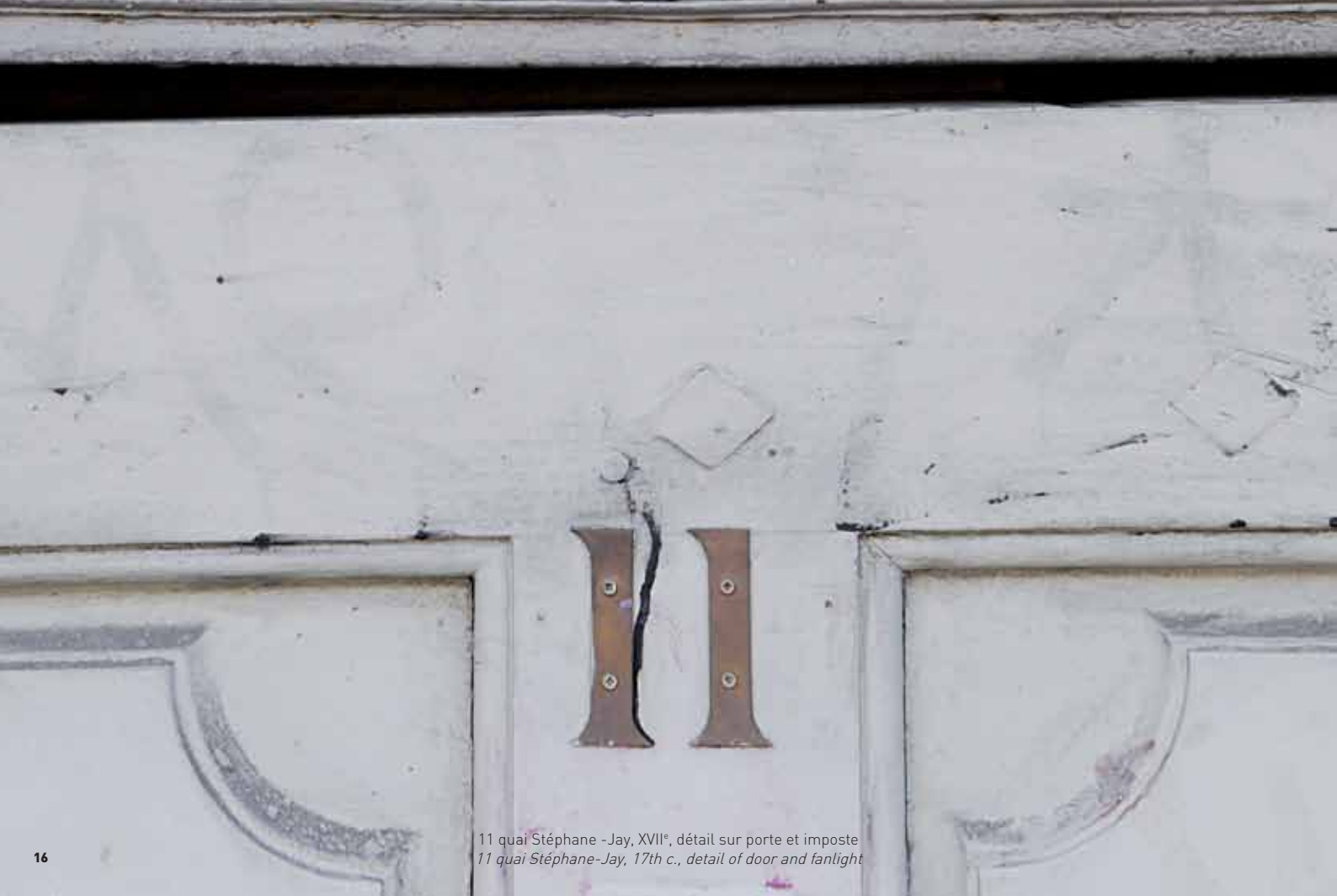
11 quai Stéphane - Jay, XVII e , détail sur porte et imposte 11 quai Stéphane - Jay, 17th c., detail of door and fanlight