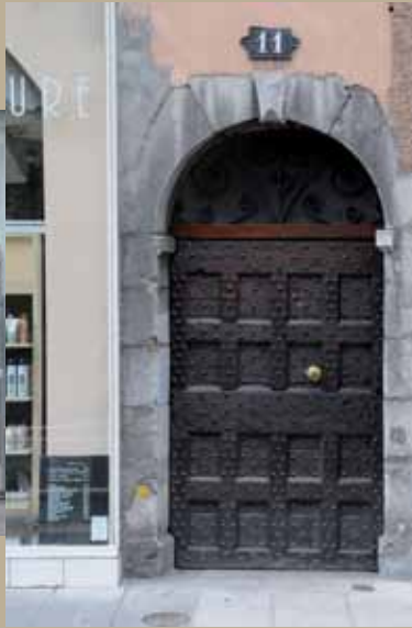
11 rue Montorge, XVII e , porte cloutée 11 rue Montorge, 17th c., studded door