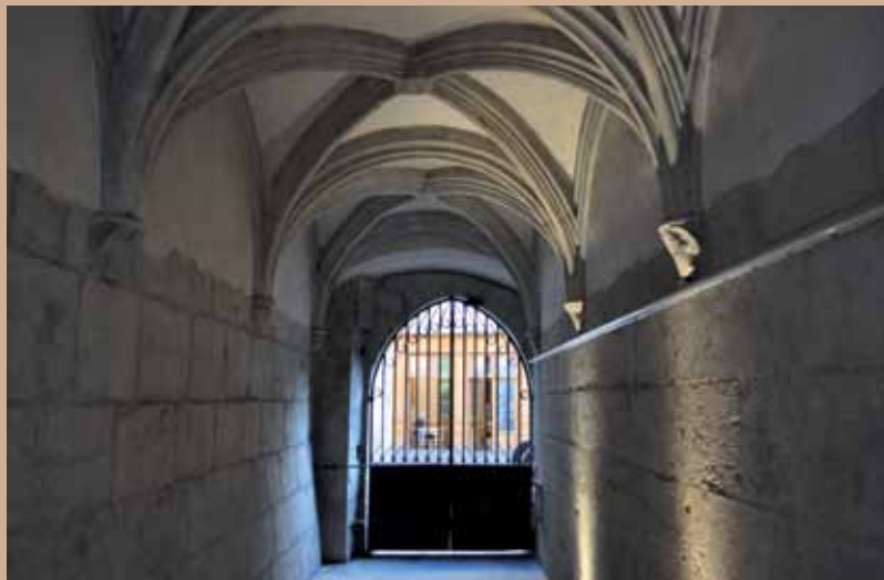
22 rue Barnave, portail en ferronnerie et passage voûté sur croisées d'ogives 22 rue Barnave, wrought iron gate and vaulted passage