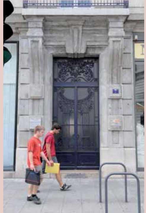
7 rue Félix-Viallet, début XX e 7 rue Félix-Viallet, early 20th c.