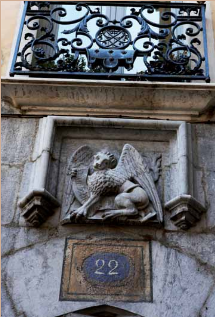
22 rue Barnave, fin XV e /début XVI e , ancien hôtel François Marc, lion ailé de saint Marc

22 rue Barnave, late 15th c., early 16th c., former François Marc mansion, St Marc's winged lion