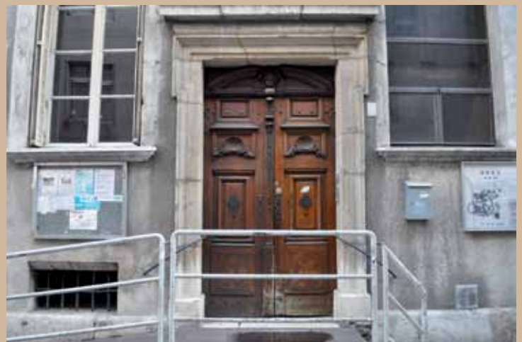
9 rue de la Poste, début XVIII e 9 rue de la Poste, 18th c.