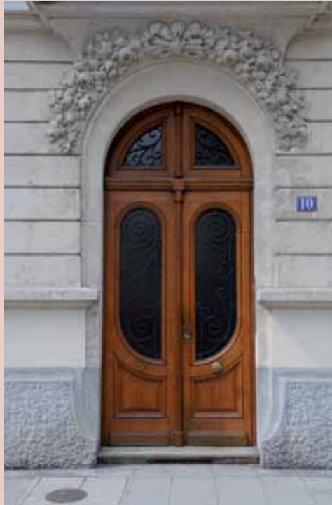
10 boulevard Gambetta, début XX e , style Art nouveau 10 boulevard Gambetta, early 20th c., Art Nouveau

16 boulevard Édouard-Rey, early 20th c., Caisse d'Épargne logo