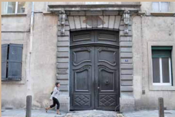
6 rue Voltaire, XVII e , ancien hôtel de la Première Présidence, porte époque Louis XV 6 rue Voltaire, 17th c., former seat of the speaker of the Dauphiné parlement, Louis XV door