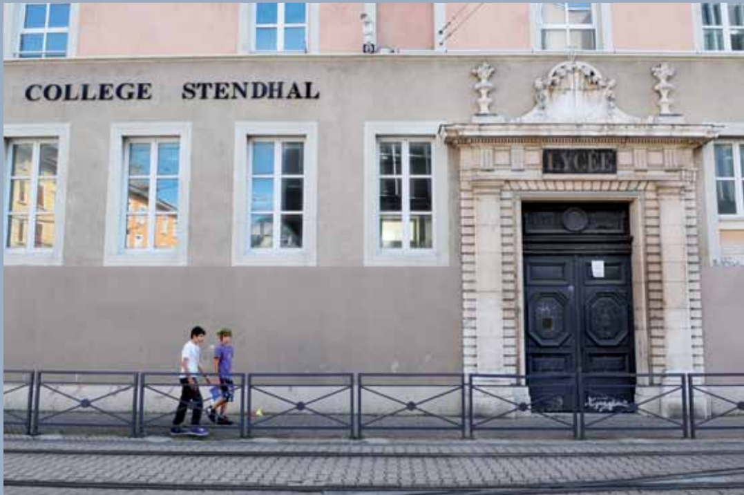
1 rue Raoul-Blanchard, encadrement XVII e , collège et lycée Stendhal, ancien collège des Jésuites, ancienne École Centrale où Stendhal fut élève 1 rue Raoul-Blanchard, 17th c. frame, Collège and Lycée Stendhal, former Jesuit secondary school, where Stendhal was a pupil