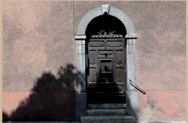
10 rue Hector-Berlioz, XVII e 10 rue Hector-Berlioz, 17th c.