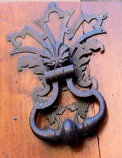
3 place Claveyson, XVIII e , heurtoir. 3 place Claveyson, 18th c., knocker