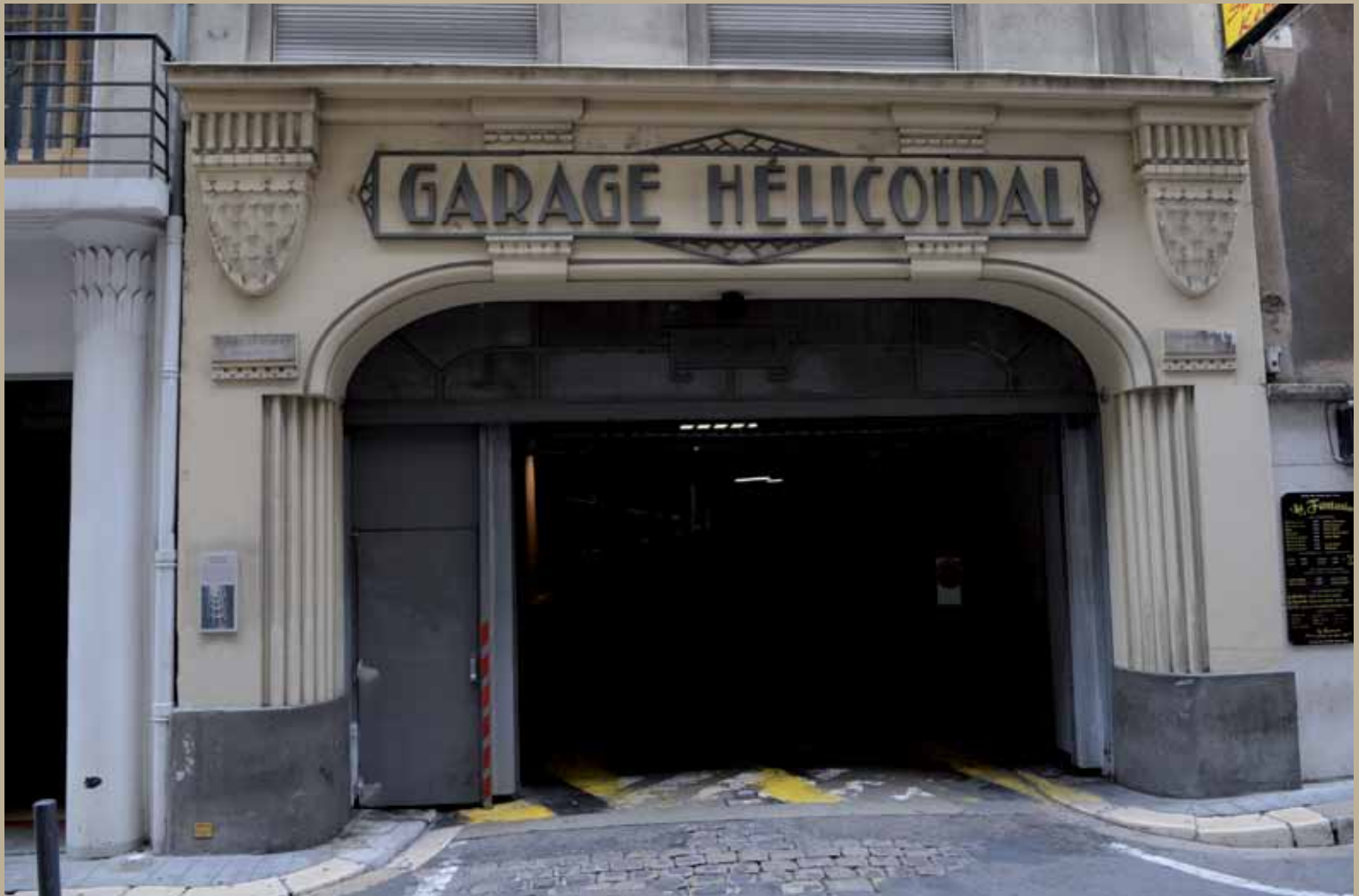
6 rue Bressieux, XX e , garage Hélicoïdal fin Art déco [1928] 6 rue Bressieux, 20th c., late Art Deco spiral garage (1928)