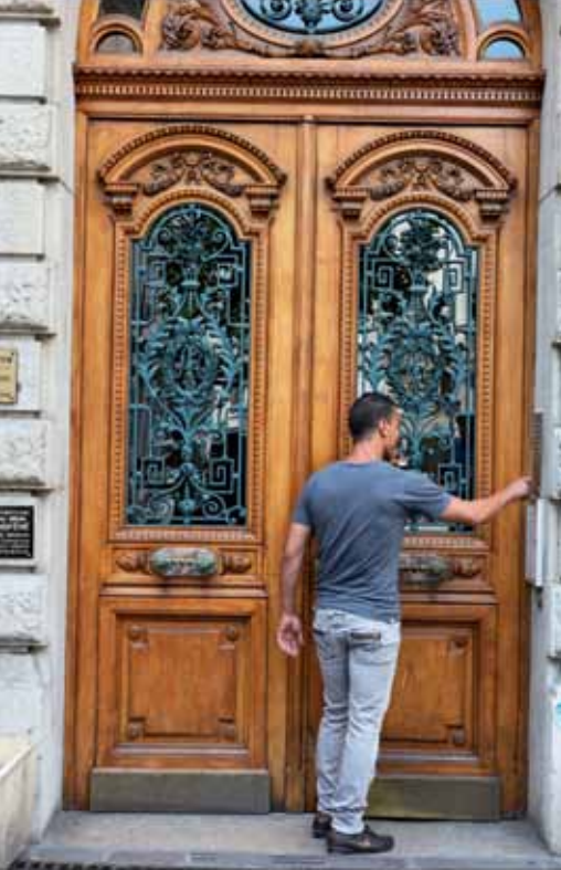
16 place Notre-Dame, XIX e , porte associant bois, verre et serrurerie