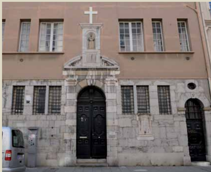
17 rue Voltaire, XVII e , chapelle de l'Adoration, ancienne chapelle des Pénitents avec armoiries sculptées 17 rue Voltaire, 17th c. Penitents' chapel with sculpted coat of arms