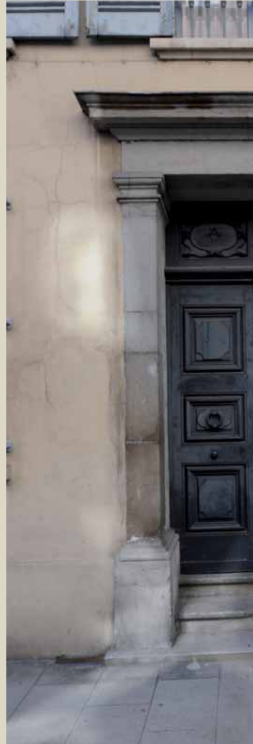
5 rue Voltaire, Empire, ancien hôtel particulier 5 rue Voltaire, early 19th c., private mansion