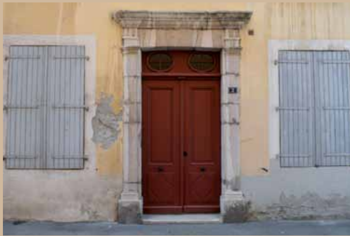
2 rue du Fer-à-Cheval, XVIII e 2 rue du Fer-à-Cheval, 18th c.