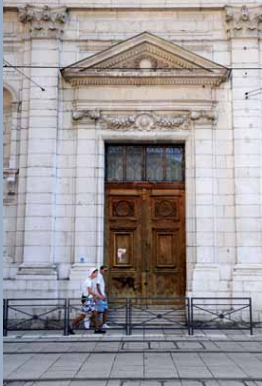
1 rue Raoul-Blanchard, porte de la chapelle 1 rue Raoul-Blanchard, chapel door