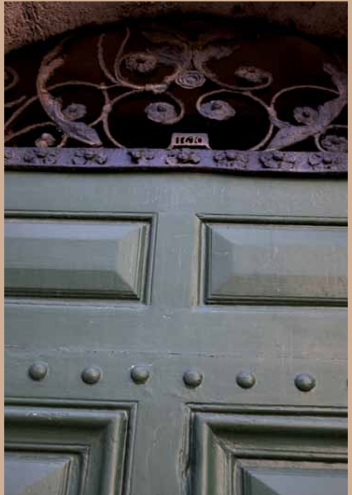
3 rue du Palais, XVII e , avec grille ouvragée et datée 3 rue du Palais, 17th c., wrought iron fanlight with date

22 rue Barnave, late 15th c., early 16th c., former François Marc mansion, St Marc's winged lion