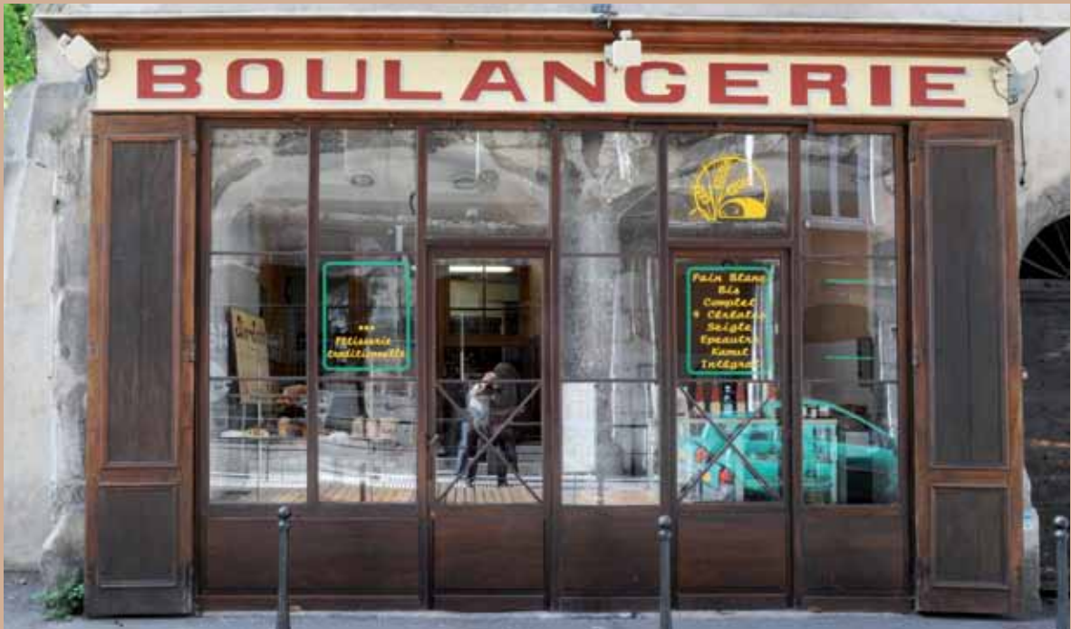
64 rue Saint-Laurent