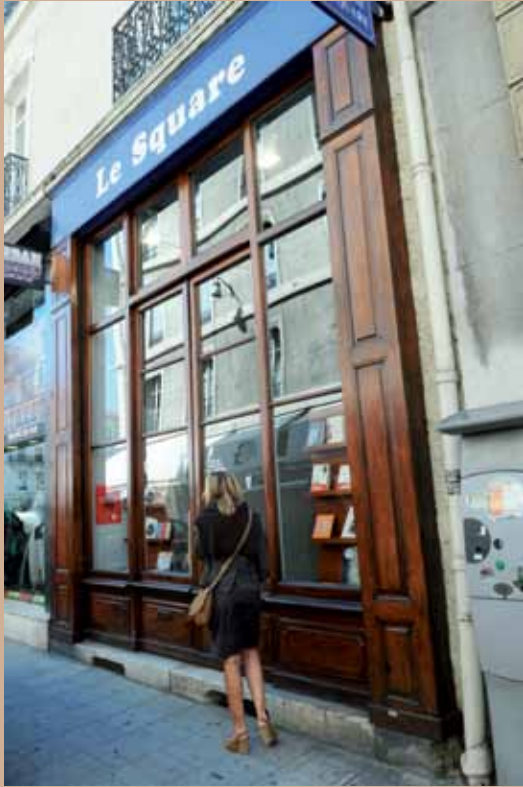
2 square Léon-Martin (façade rue de Sault)