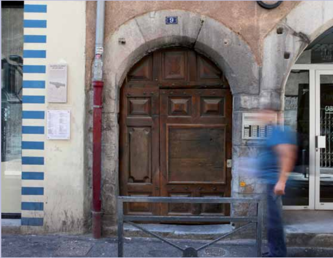
9 rue Chenoise, ancien hôtel particulier du début XVI e 9 rue Chenoise, private mansion from early 16th c.