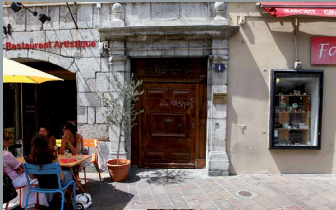
4 place Sainte-Claire, XVII e , masque grimaçant 4 place Sainte-Claire, 17 th c., scowling face