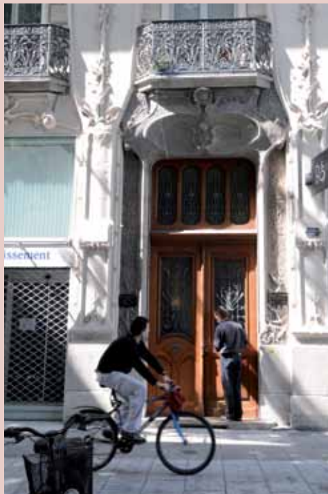
2 boulevard Gambetta, début XX e , style Art nouveau 2 boulevard Gambetta, early 20th c., Art Nouveau