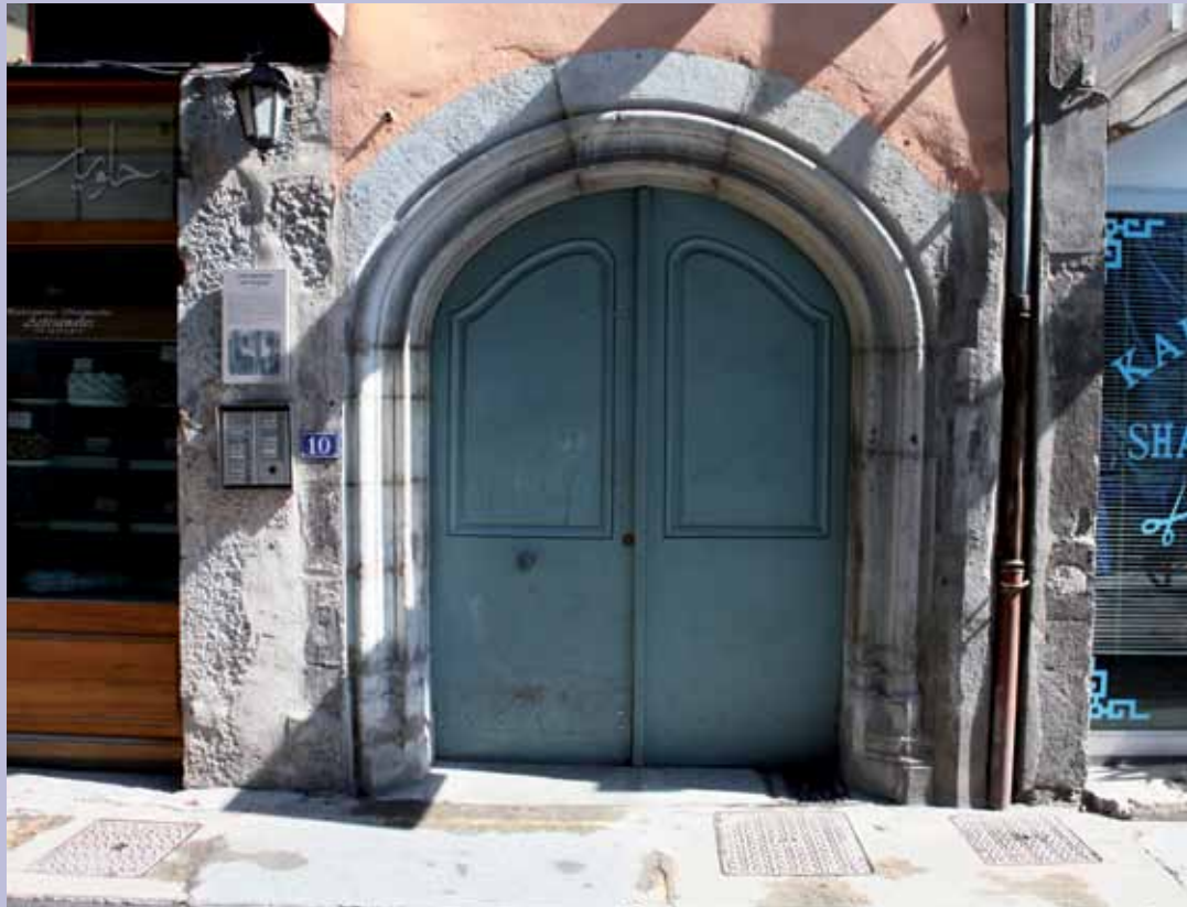
10 rue Chenoise, ancien hôtel particulier du début XVI e 10 rue Chenoise, private mansion from early 16th c.