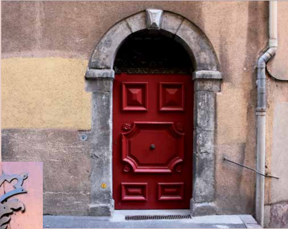
2 rue Madeleine, XVII e [1671] 2 rue Madeleine, 17th c. [1671]