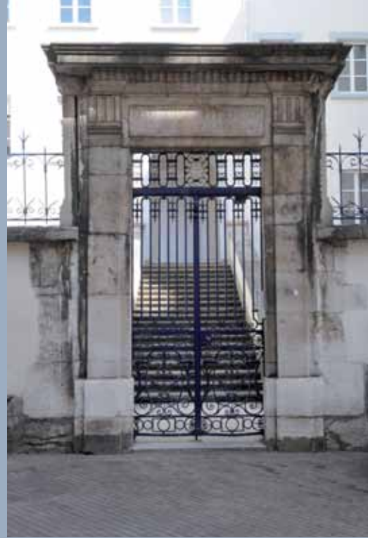
3 passage du Lycée, encadrement et grille XVIII e 3 passage du Lycée, frame and gate 18th c.