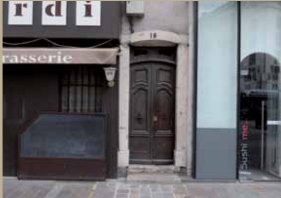
19 rue de Belgrade, XVII e 19 rue de Belgrade, 17th c.