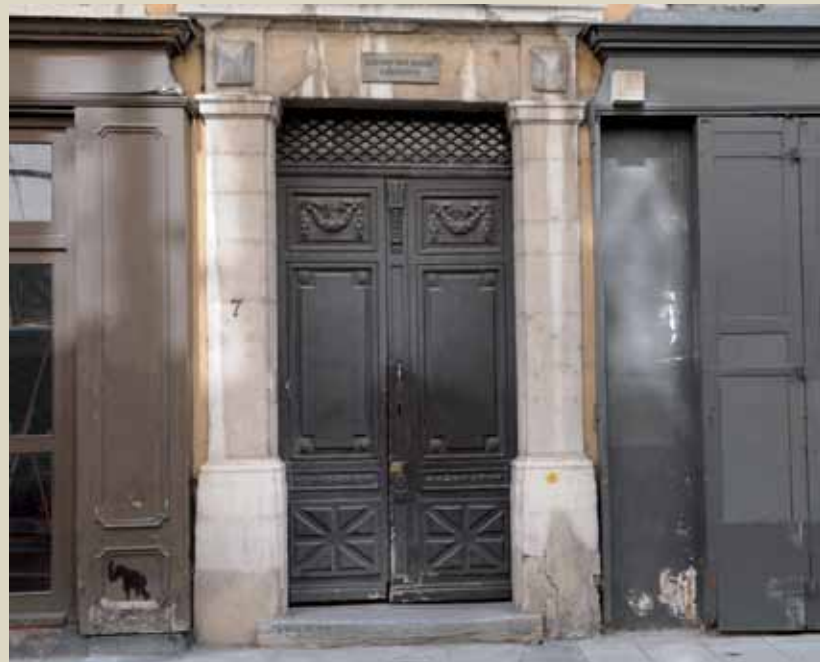
7 rue Voltaire, XVIII e 7 rue Voltaire, 18th c.