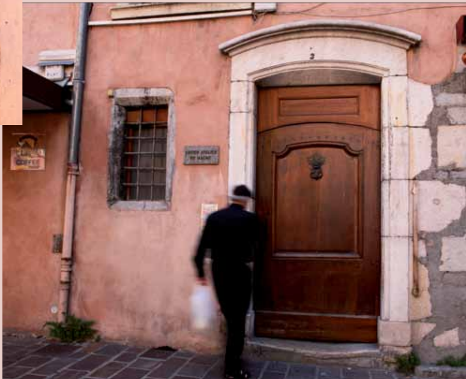
3 place Claveyson, XVIII e . 3 place Claveyson, 18th c.