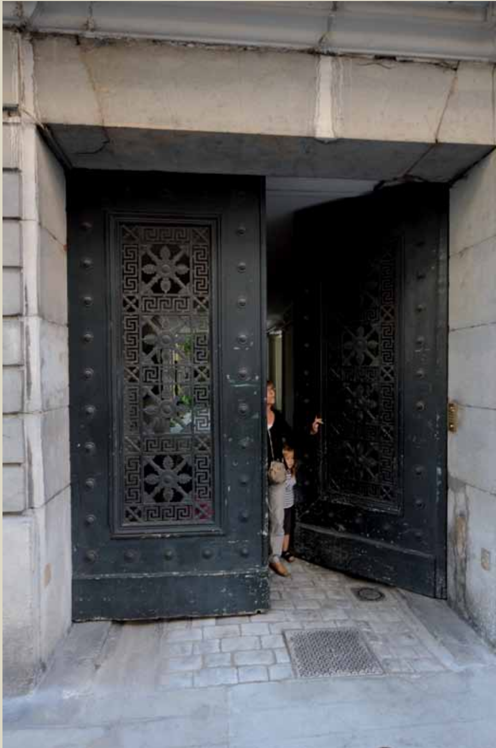
1 rue Voltaire, XIX e , panneaux en fonte avec frises à la grecque 1 rue Voltaire, 19th c., iron panels with imitation Greek design