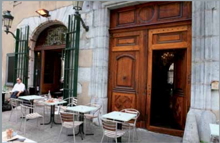
4 place Lavalette, XVIII e 4 place Lavalette, 18 th c.