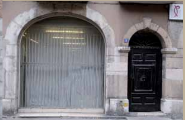
2 rue de Miribel, XVII e 2 rue de Miribel, 17th c.