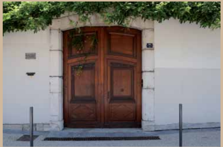
7 quai Stéphane-Jay, XVIII e , ancien hôtel de Viennois 7 quai Stéphane-Jay, 18th c., former Viennois mansion