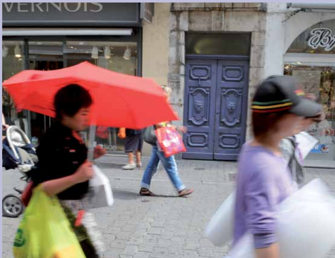
9 rue de Bonne, XVII e / début XVIII e 9 rue de Bonne 17th c., early 18th c.