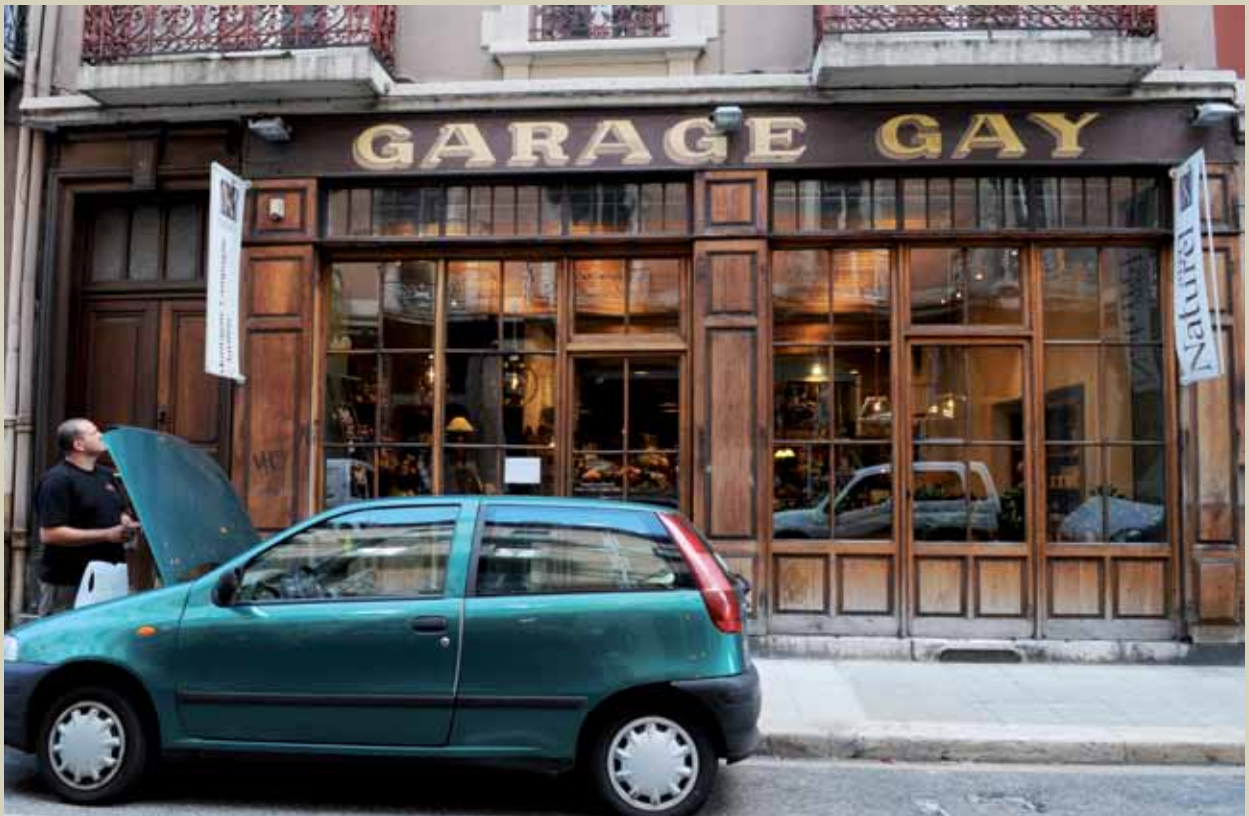
6 rue Paul Bert