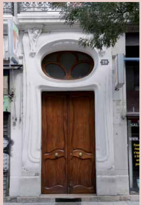
6 rue Docteur-Mazet, début XX e , style Art nouveau 6 rue Docteur-Mazet, early 20th c., Art Nouveau