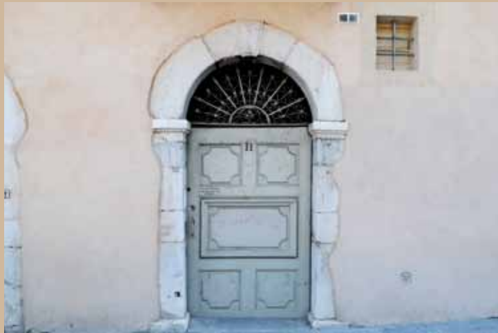
11 quai Stéphane-Jay, XVII e 11 quai Stéphane-Jay, 17th c.