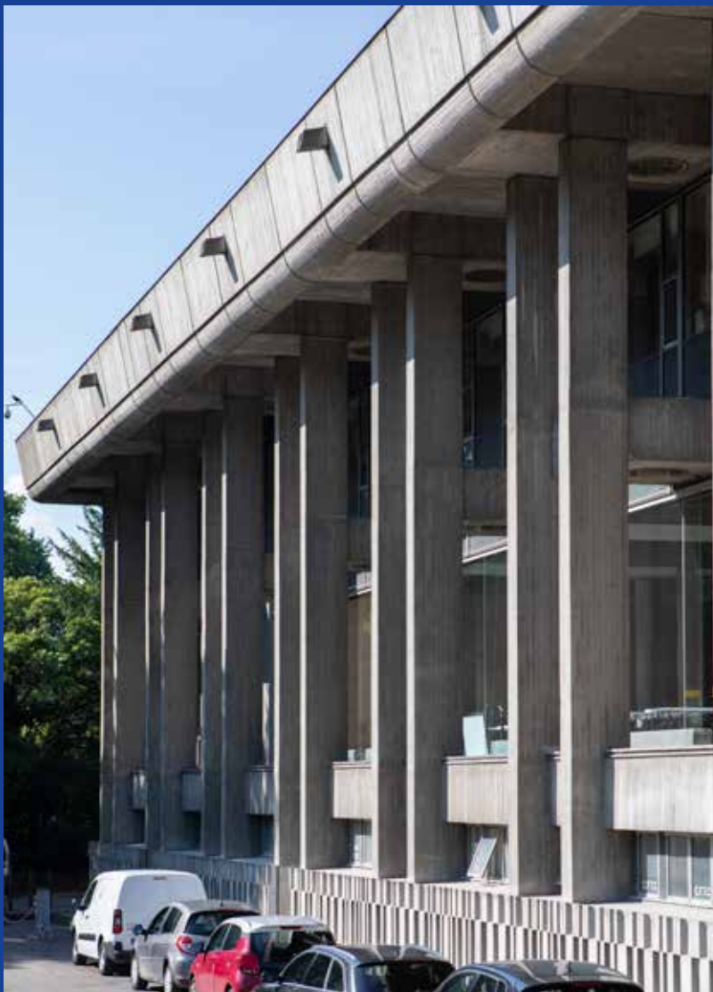
La corniche et le péristyle de la galette