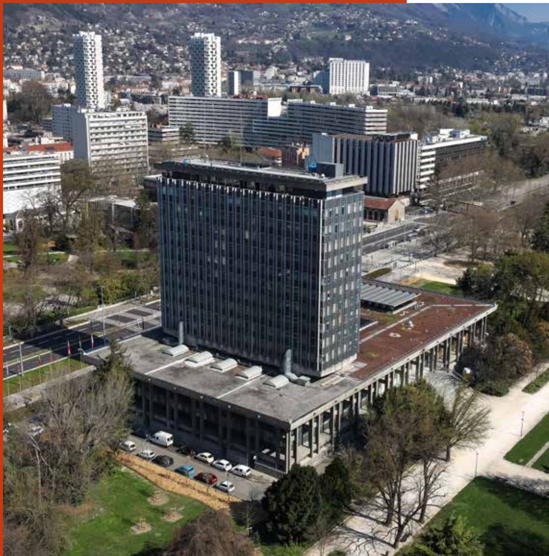
Photo de couverture : L'hôtel de ville : la galette et la tour

Ci-contre : L'hôtel de ville en lisière du parc Paul-Mistral