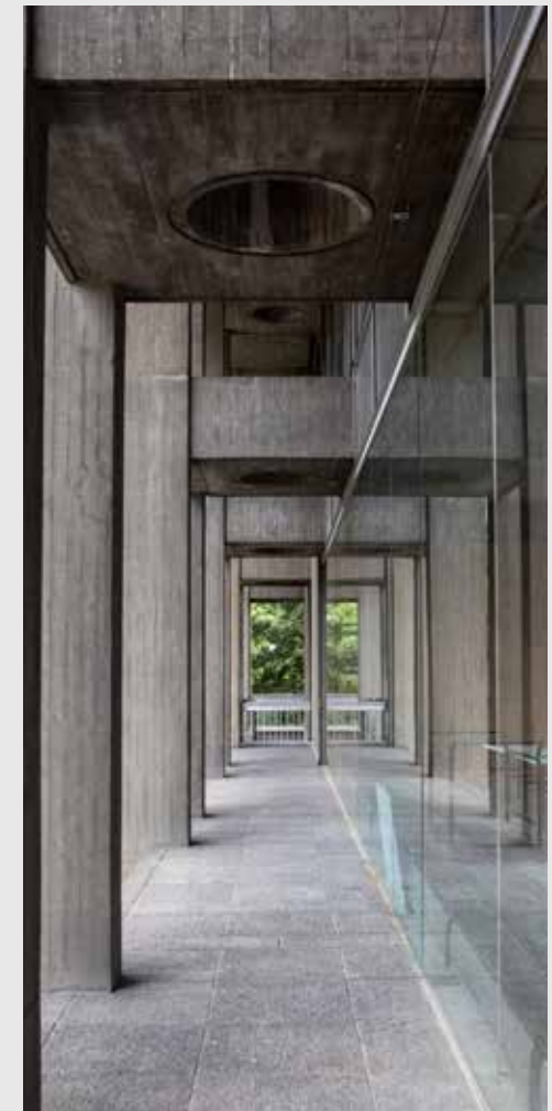
Une transparence autorisée par le mur-rideau en verre