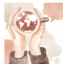
CAFÉ DU MONDE

On y parle des différentes cultures, de l'accès aux droits, on part en visite ou on se réunit autour d'activités créatives, le tout en parlant Français ! Accès libre et gratuit