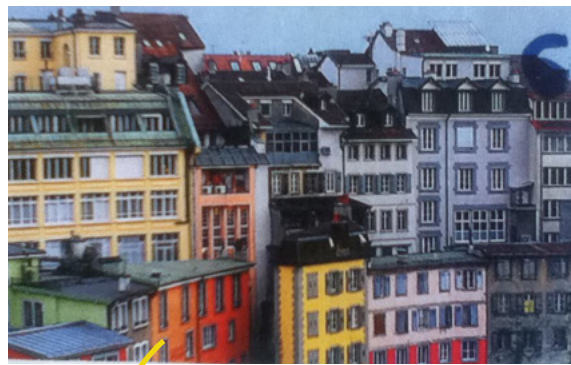
couleurs à l'intérieur