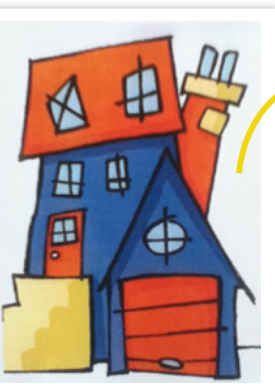
aspect décallé et ludique