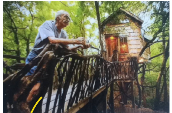
passerelle / lien avec le parc