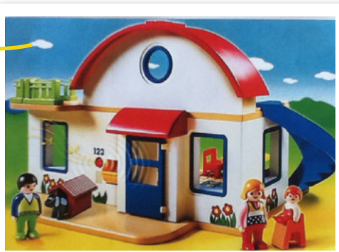
côté ludique, bibliothèque familiale