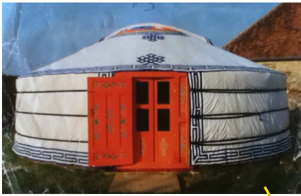
dans le jardin une yourte pour les animations