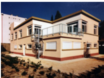
La bibliothèque en 1989

Le pavillon qui abrite aujourd'hui la bibliothèque Alliance apparaît sur les photos aériennes de 1945, pas sur celles de 1926. Sa construction semble liée à la réorganisation du site industriel dont la démolition complète a eu lieu à la fin des années 1980. Sur la photo aérienne de 1993, le pavillon marque l'entrée du parc situé au coeur de l'ensemble résidentiel construit au nord et de la zone à vocation économique au sud. En presque 25 ans, la végétation a progressivement fait disparaître le bâtiment.