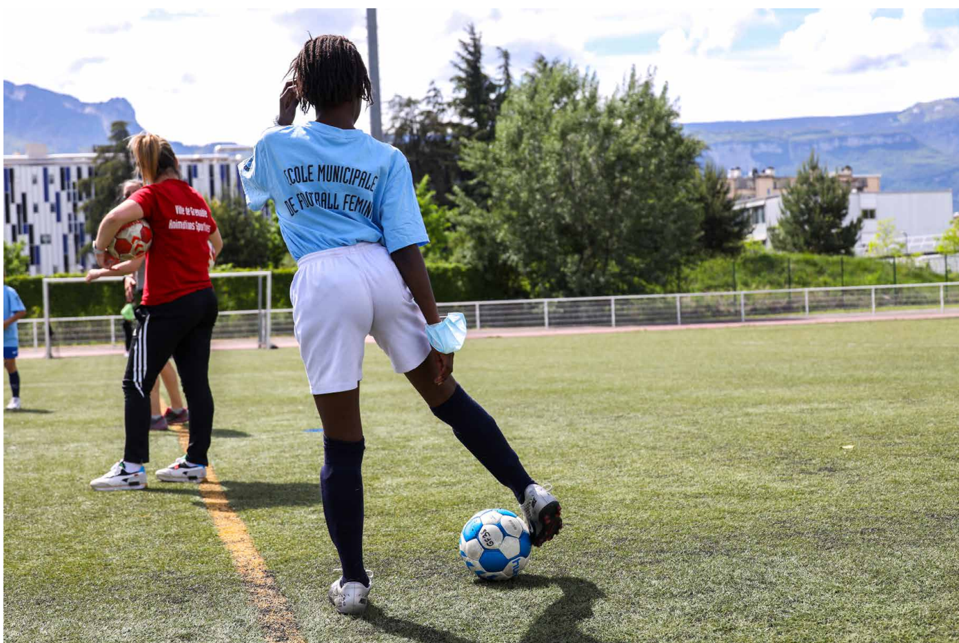
Ecole de foot féminin