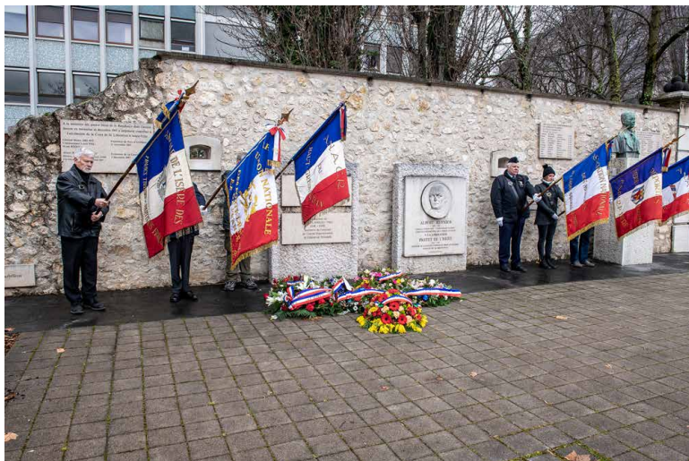
Cérémonie d'hommage aux résistantes 2023