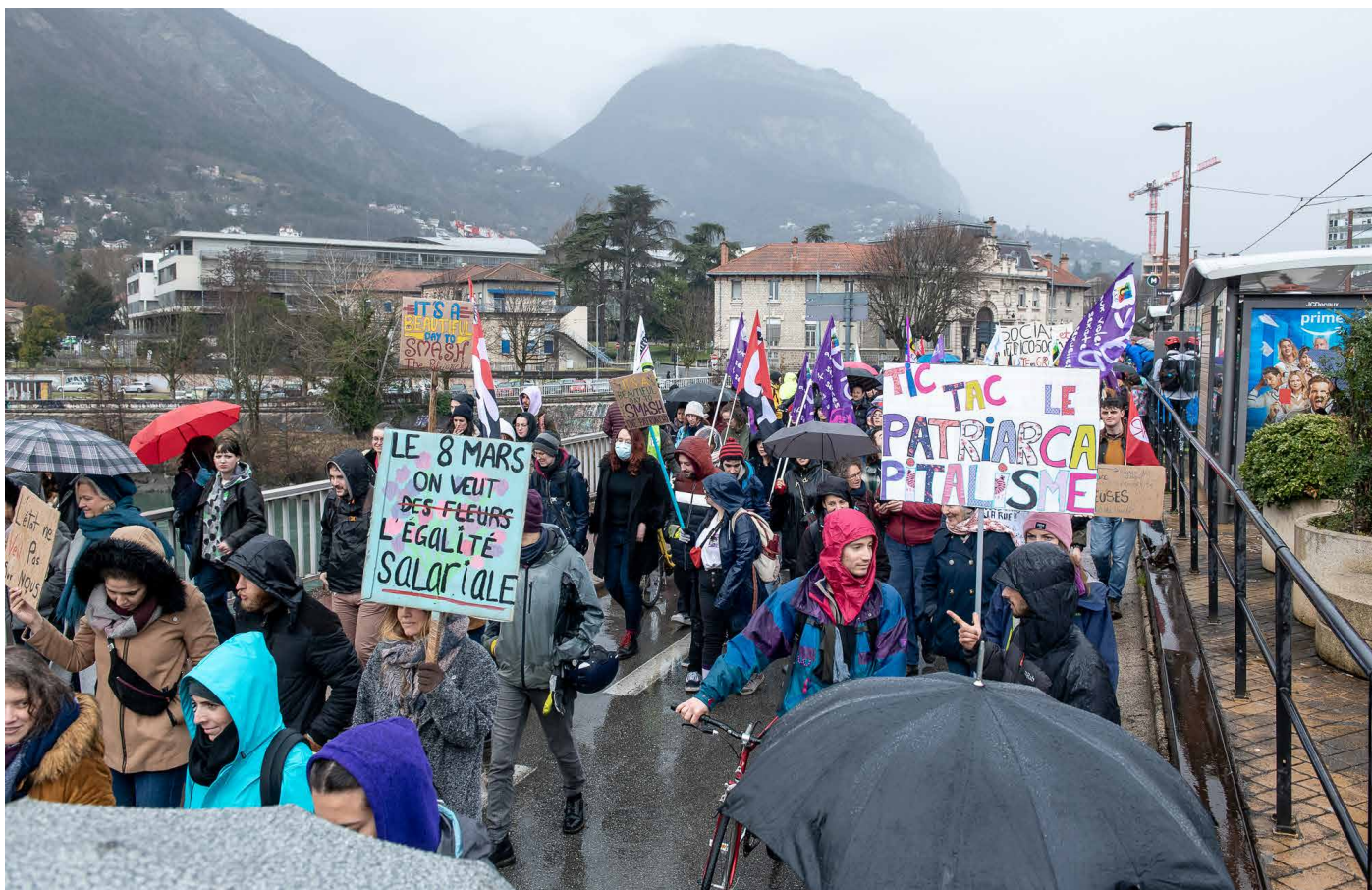
Manifestation du 8 mars 2023