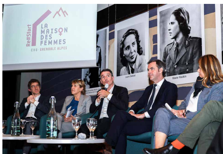
Inauguration de la Maison des Femmes