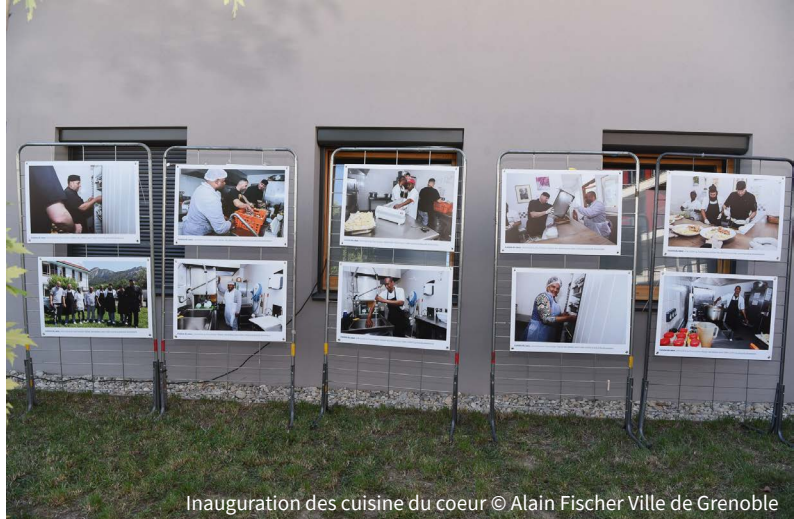
Inauguration des cuisines du coeur