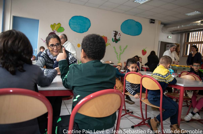
Cantine Pain Levé