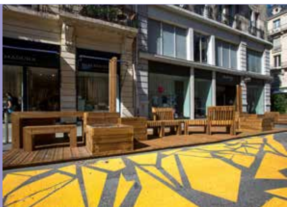
Aménagements éphémères de la rue de la République.