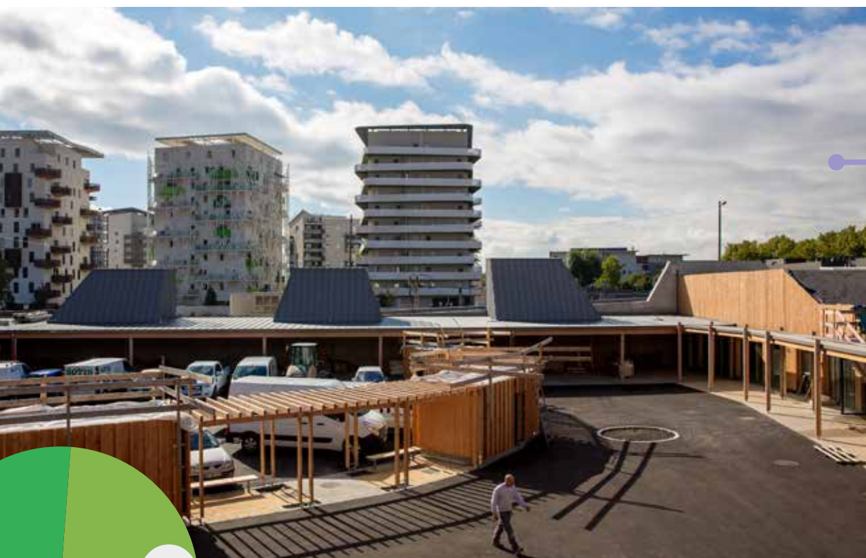
L'école Simone-Lagrange en cours de construction