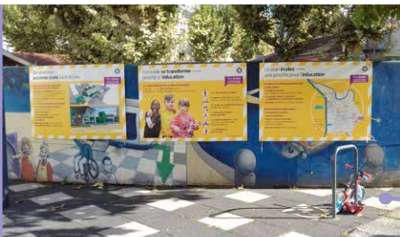
Travaux à l'école Saint-Bruno.