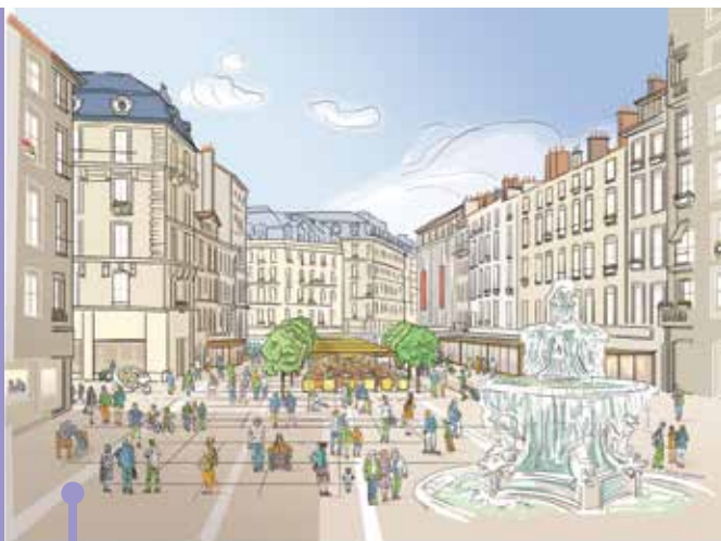
Projet de piétonisation de la place Grenette.