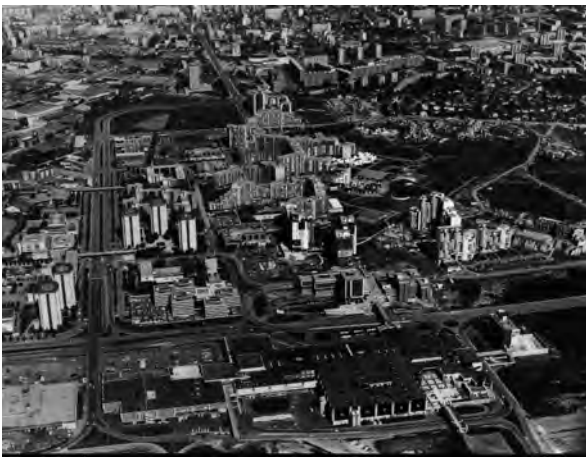
III.1 : Vue du quartier de la Villeneuve lors de sa construction; 3 Fi 00099