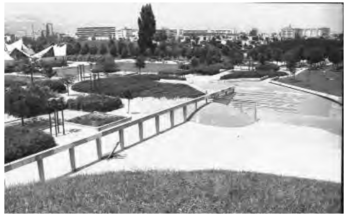
III.2 : vue du parc Jean Verlhac; Photographie numérisée, fonds des Archives Municipales de Grenoble; 3 Fi 00088

Destiné aux lecteurs des Archives, ce document propose d'abord une description synthétique du sujet puis un instrument de recherche regroupant les références sur les différents thèmes propres au quartier de la Villeneuve. Pour la plupart des sources, il est donné le type du document et sa date si elle est connue, un descriptif bref et la cote du document pour le localiser.