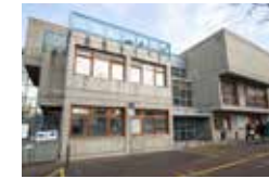
La Maison des Habitants de l'Abbaye : une offre de services au cœur du quartier