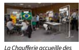
La Chaufferie accueille des manifestations d'envergure comme les Assises Citoyennes