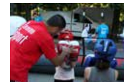
Chaque été, la caravane du sport vient à la rencontre des Grenoblois dans les quartiers