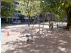
Plus de place pour la nature en ville