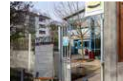
La Pirogue, un café associatif et solidaire en vogue