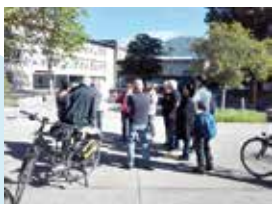
La sécurisation des écoles, une des thématiques des éco-rencontres

Après concertation avec les habitants, des modifications significatives ont été apportées pour imaginer une place conviviale et accessible à tous. Ces aménagements s'accompagnent d'un programme d'activités autour de la place, organisé avec les acteurs du quartier. Plus globalement, ce réaménagement illustre le travail réalisé autour des places, squares et jardins du territoire pour créer un parcours de verdure propice au repos et à la détente.