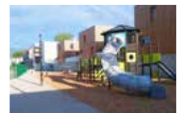
Un espace de jeux co-construit au nouveau Châtelet