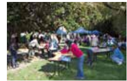
Quand les habitants du quartier se réapproprient le parc Soulage...