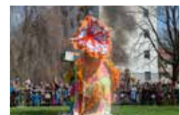
L'incontournable carnaval de l'Abbaye...