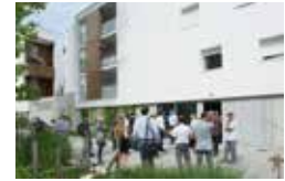
Accueillir les nouveaux arrivants sur le secteur, un axe fort du projet de territoire