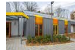
L'école Jean Racine : une rénovation réussie