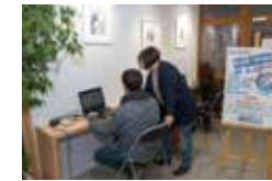
Le pôle informatique de proximité animé par l'association FACILE

Abbaye • Jouhaux • Châtelet Teisseire • Malherbe • Bajatière