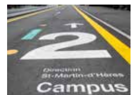
Une signalétique spécifique pour une circulation apaisée