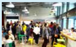
La Chaufferie : un nouvel équipement jeunesse pour le secteur