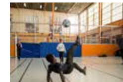
Le gymnase Jouhaux propose des plages horaires pour les jeunes du quartier