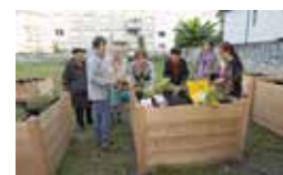
Installation de jardin éphémère rue de Stalingrad