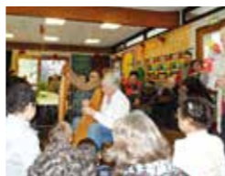
Des activités intergénérationnelles en développement