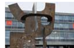
Le rayonnement du Conservatoire régional de musique: un atout pour le territoire