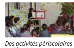
Des activités périscolaires variées