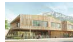
Future école Flaubert en matériaux bio-sourcés: terre et bois © Agence Roda Architectes