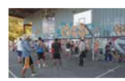
Le Play Ground de la Bifurk: un équipement sportif innovant sur le territoire