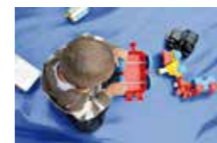
Une offre « petite enfance » de qualité

Secteur 4 Alliés - Alps Beauvert - Reyniès Capuche Grands-Boulevards Exposition Bajatière