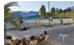
La plage de la Bifurk: du beach volley en ville