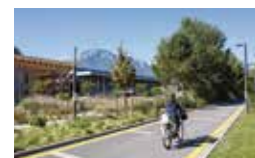
Déplacement en mode doux: un axe vélo exemplaire sur le territoire