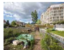
Les jardins partagés à Beauvert