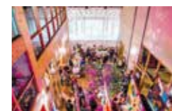
Le centre chorégraphique du Pacifique ouvre ses portes au plus grand nombre