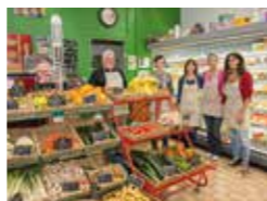
Le magasin Episol: une épicerie sociale et solidaire