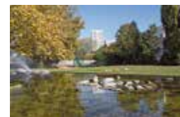
Le parc Pampidou: écrin de verdure à multiples usages