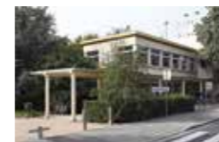
Alliance: une bibliothèque transformée au service des habitants