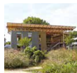
Terra Nostra: prototype des constructions de demain