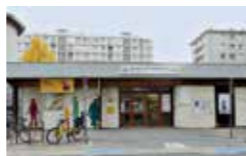
La MDH Capuche: un lieu de vie ouvert à tous