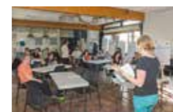
Des espaces de rencontres et d'apprentissage collectifs