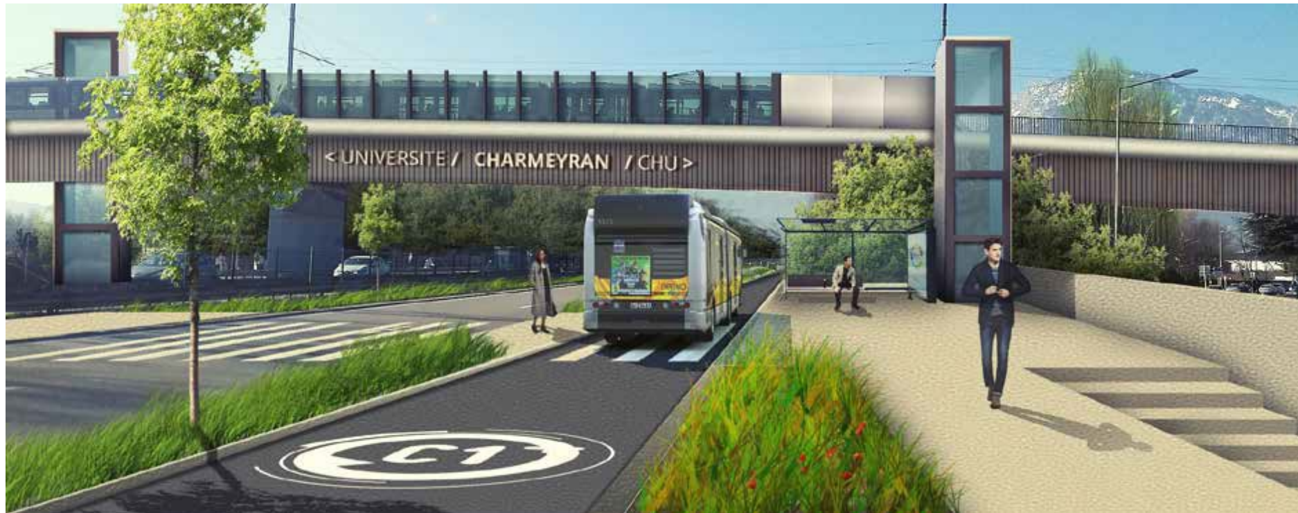
Photomontage d'un scénario d'aménagement (réalisation AURG)