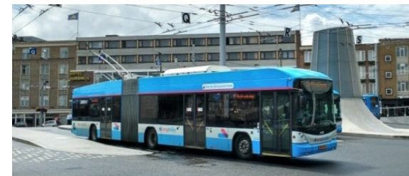
Le trolleybus 2.0 aux Pays-Bas