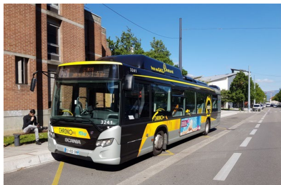
Le bus chrono C1