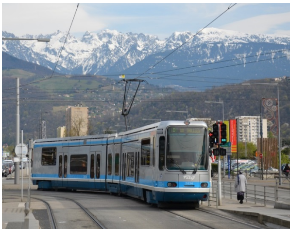
Le tramway (ligne D)