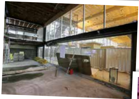
ESPACE DE VENTE MULTIMODAL mai 2015