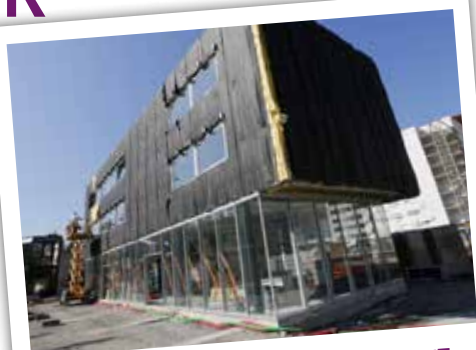
RÉALISATION DU NOUVEAU BÂTIMENT DE LA GARE ROUTIÈRE mai 2015