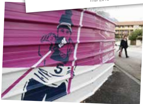
FRESQUE SUR LA BASE VIE DU CHANTIER mars 2015