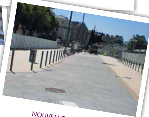
NOUVELLE VOIE TAXIS mai 2015