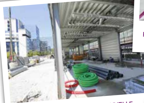
CONSTRUCTION DE LA NOUVELLE ENTRÉE GARE CÔTÉ EUROPOLE mai 2015