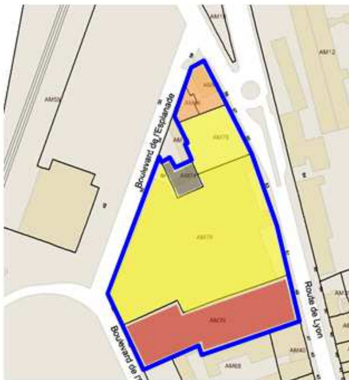
Plan parcellaire initial