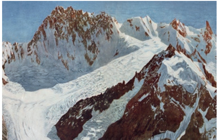
Description géométrique détaillée des Alpes françaises, par Paul Helbronner, 1921