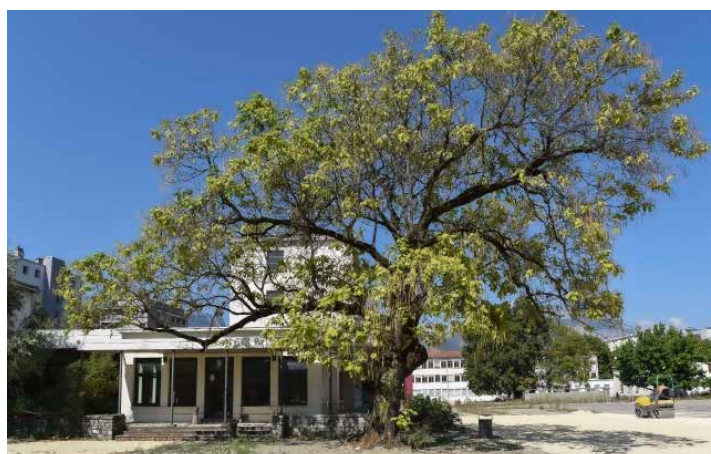
© Alain Fischer, Ville de Grenoble