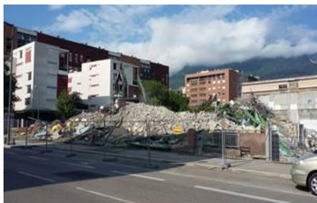
Futur bâtiment Grenoble Habitat