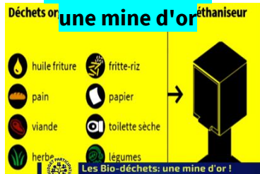
Les Bio-déchets :