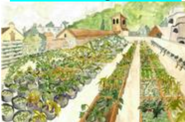
Jardins partagés sur toit