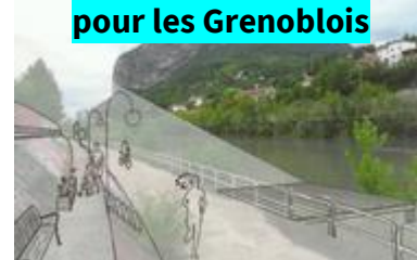
Une promenade pour les Grenoblois