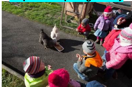
Un poulailler partagé à Abry