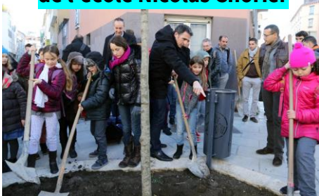
Aménagement des abords de l'école Nicolas Chorier