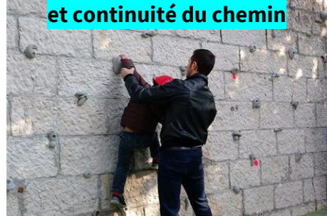
Berges de l'Isère : site d'escalade et continuité du chemin