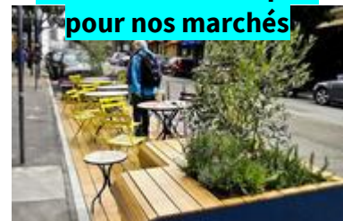
Des terrasses ludiques pour nos marchés