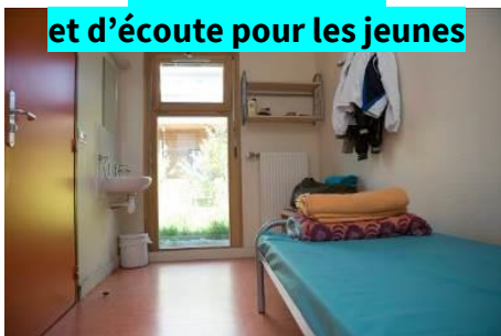
Un lieu d'accueil et d'écoute pour les jeunes