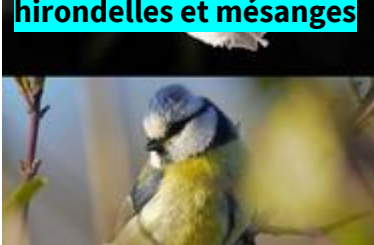
Nichoirs chauves-souris, hirondelles et mésanges