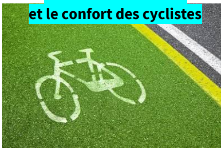
Améliorer la sécurité et le confort des cyclistes