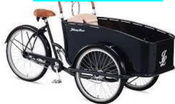
Vélos triporteurs électriques pour les habitants