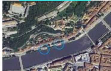
Un pas vers l'eau