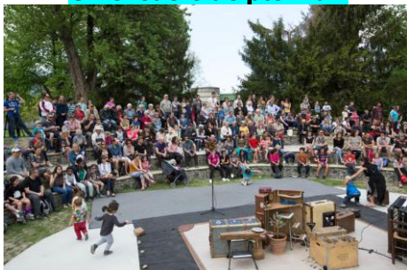
Un théâtre de plein air