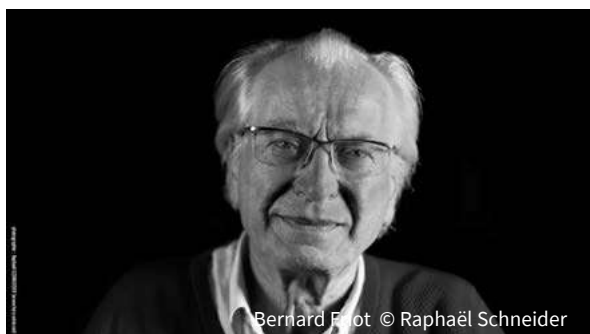
Bernard Friot