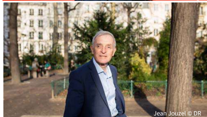
Jean Jouzel