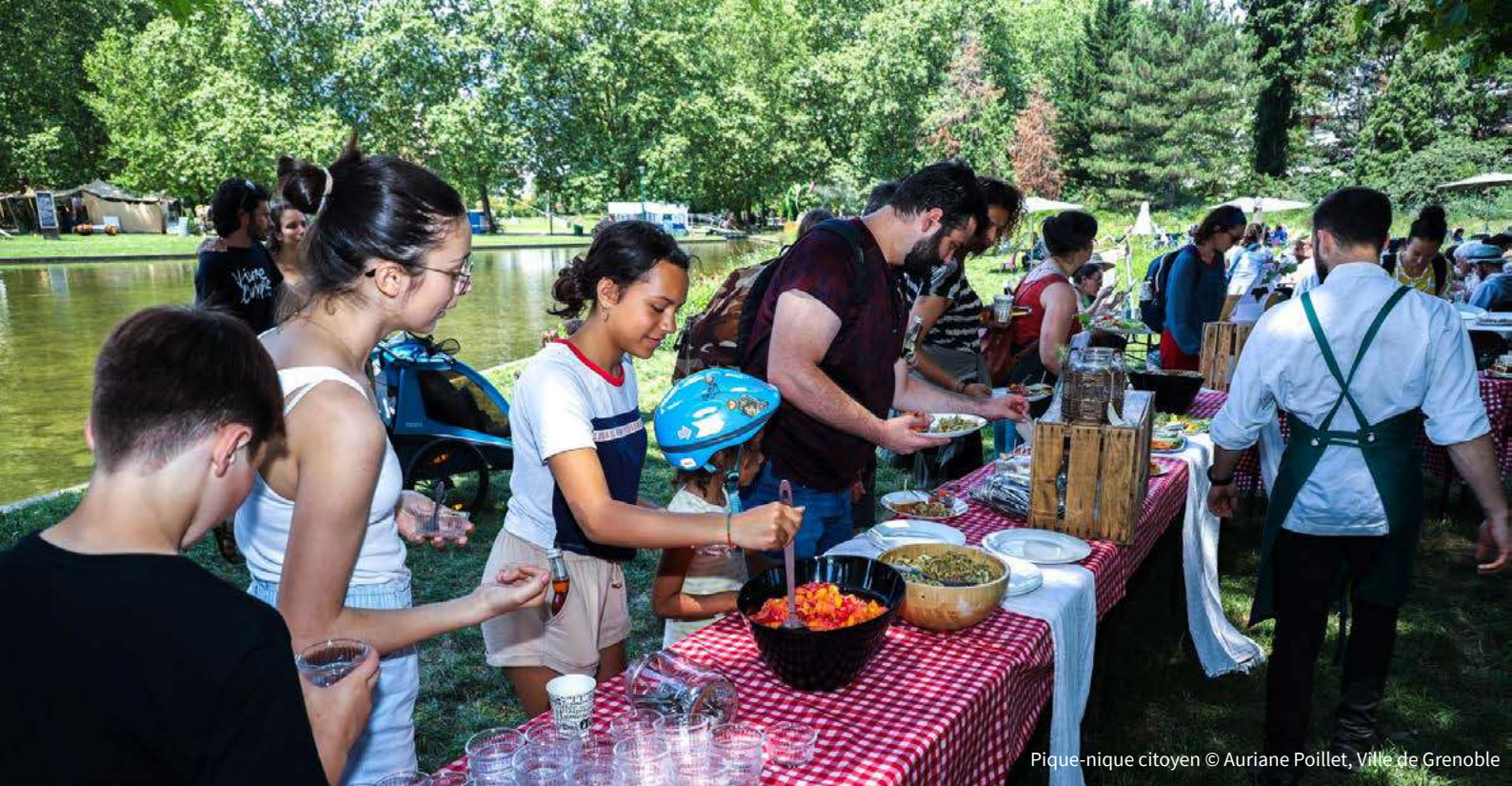
Pique-nique citoyen